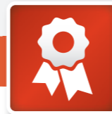
3 Jahre Garantie