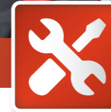
Wartung & Reparatur