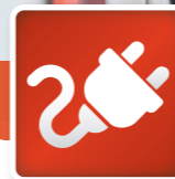
Inbetriebnahme & Einweisung