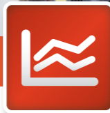
Kalibrierungs- & UVV-Service