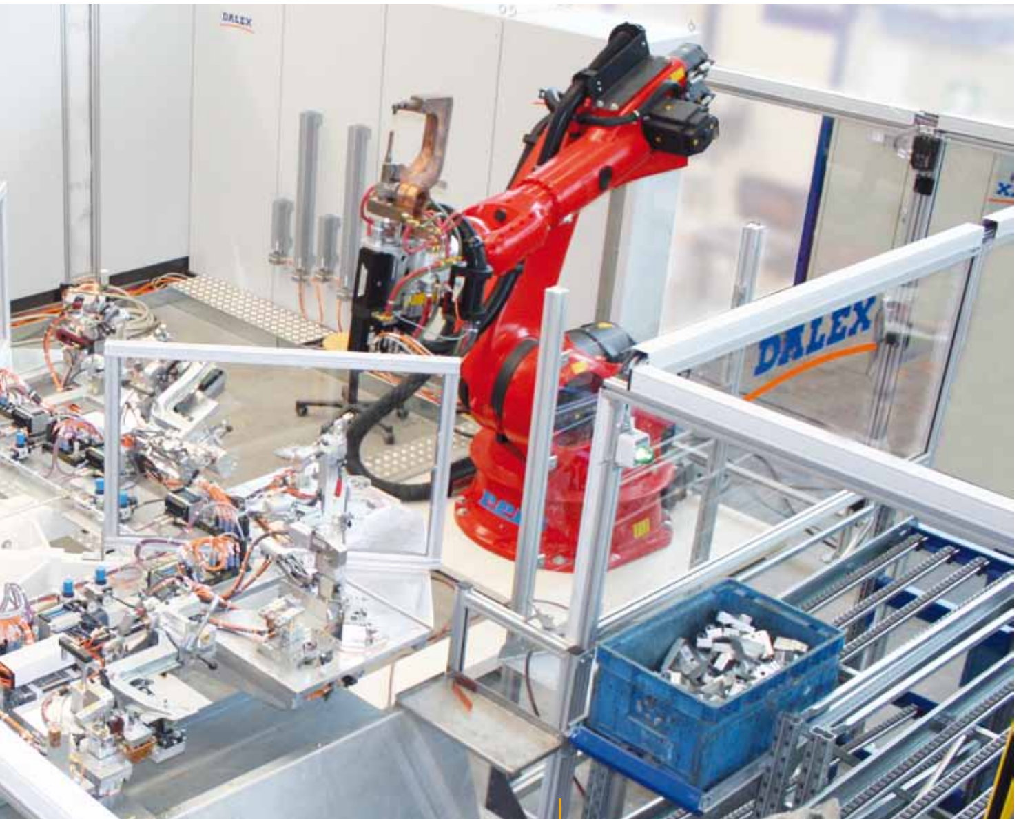
Roboter-Drehtischanlage für Pkw-Produktgruppen