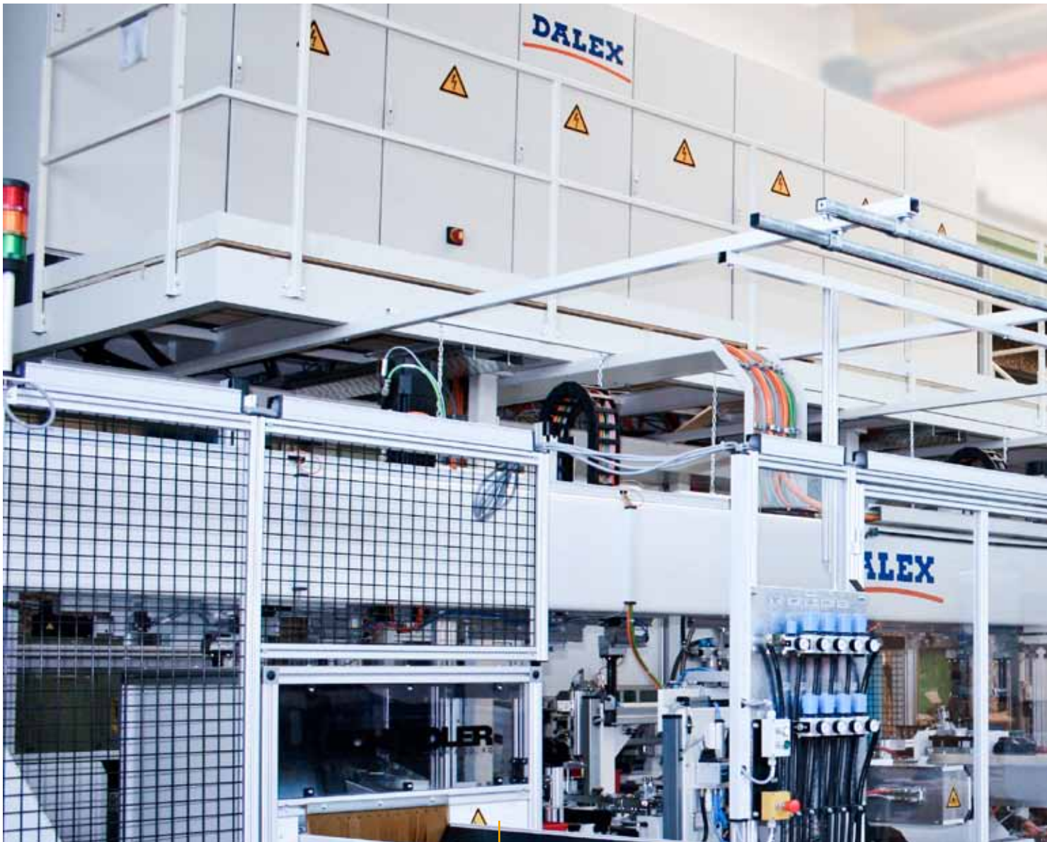
Linear-Transferanlage zum Fertigen von Schubladenseitenteilen