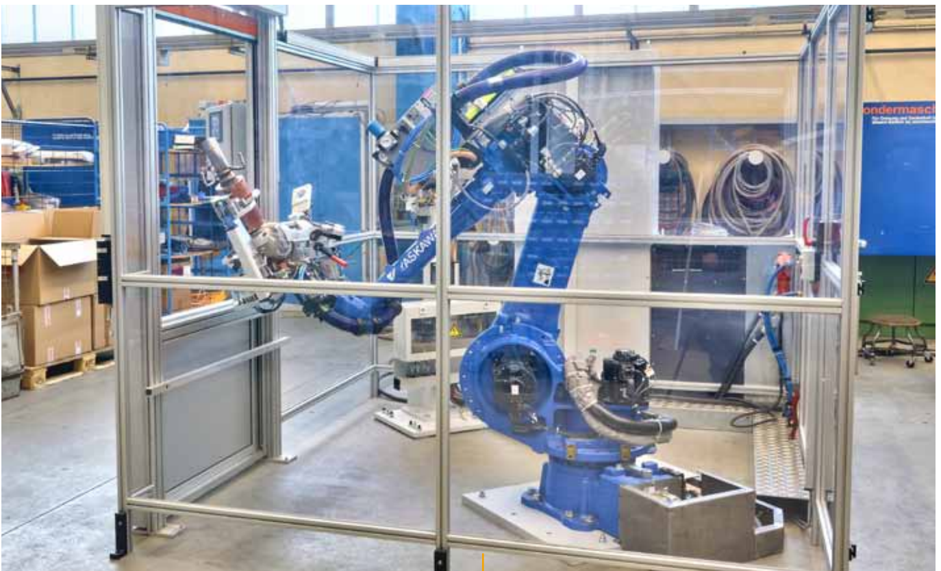
Handling-Roboter mit Werkstückträger