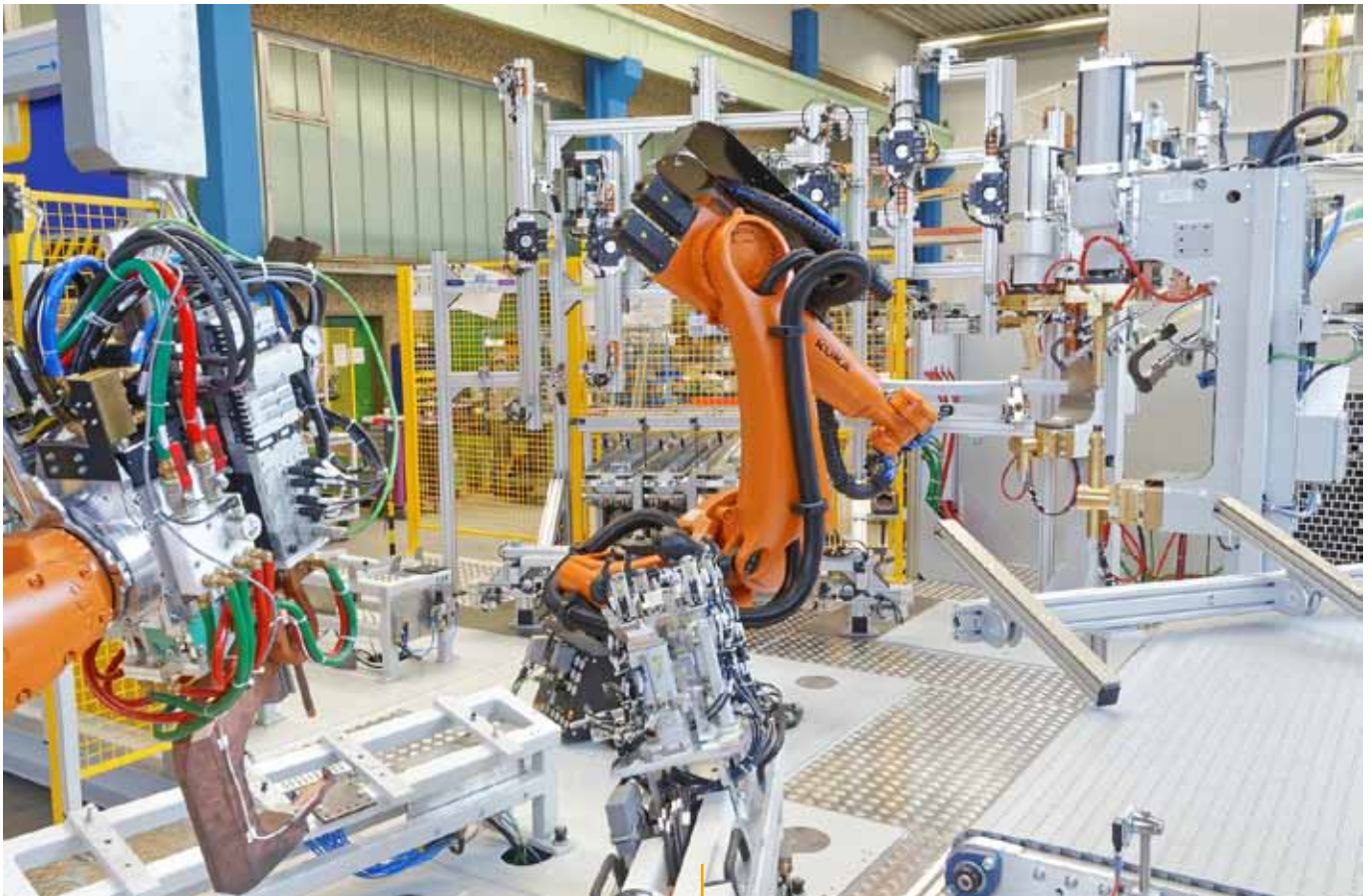
Roboterschweißanlage mit C-Modulen.