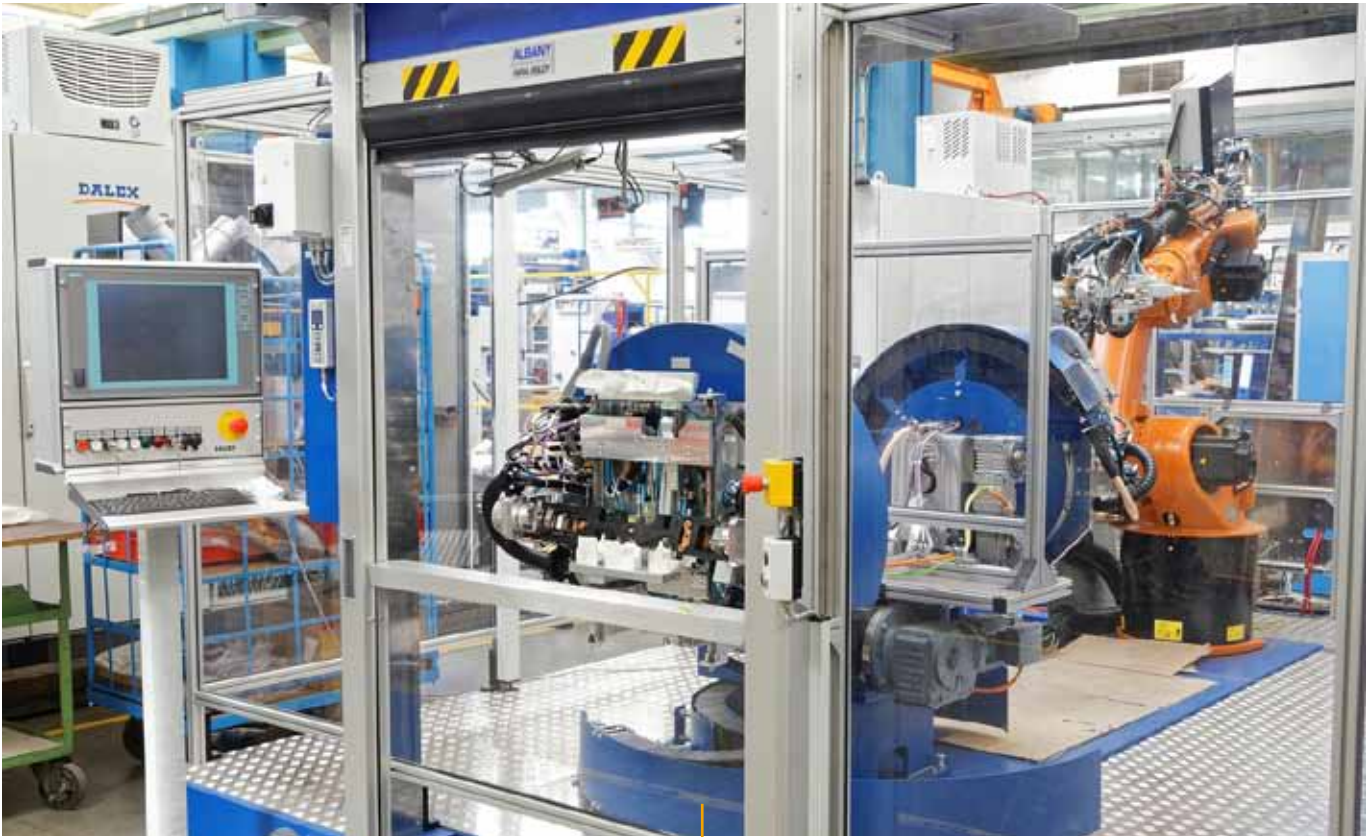
Roboter in Kombination mit Rundschalttisch