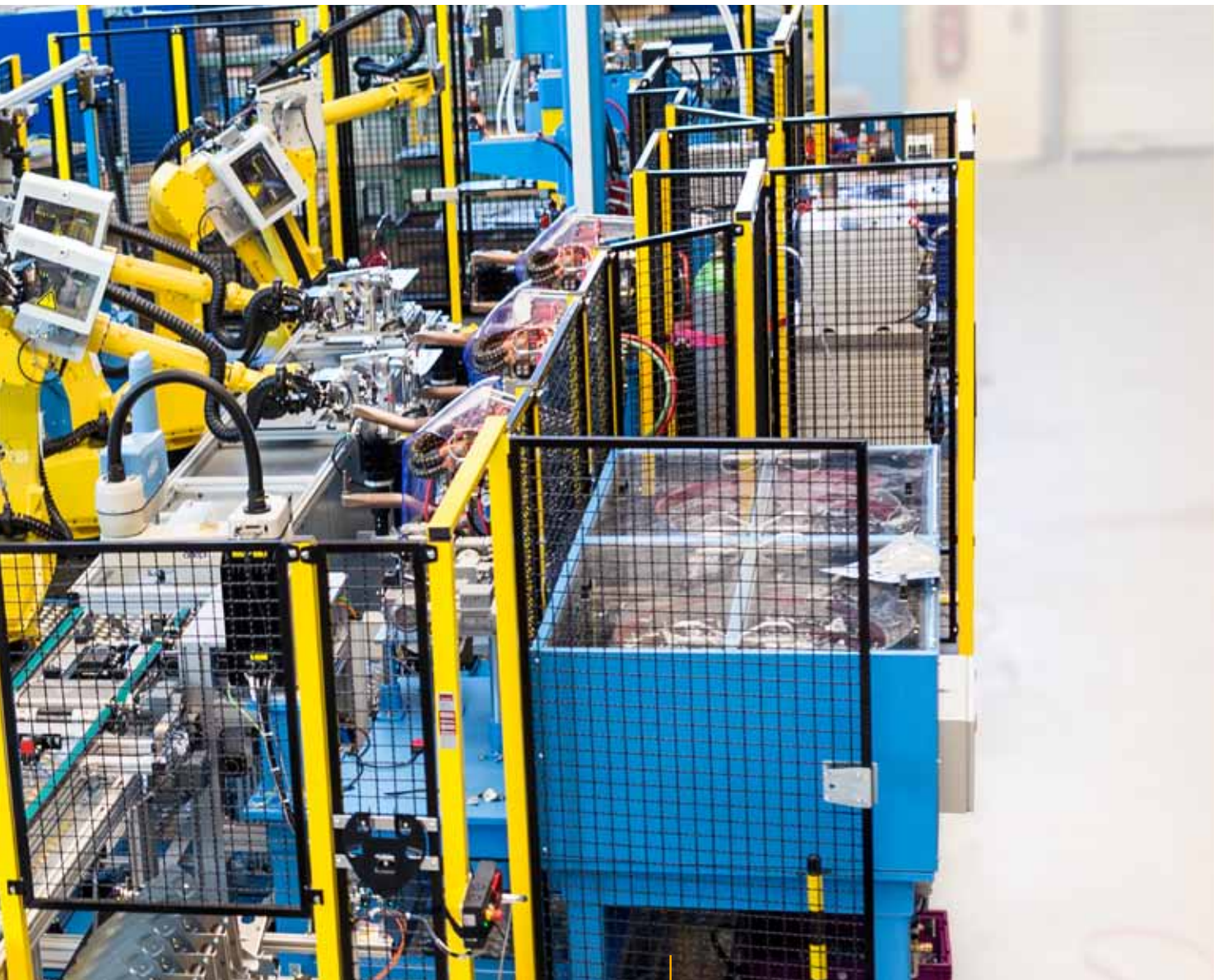
Roboter-Transferlinie für Pkw-Bauteile