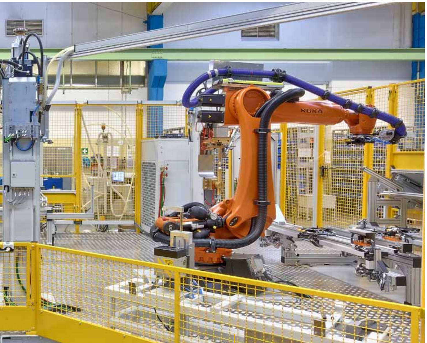
Roboter-Schweißanlage mit C-Modulen